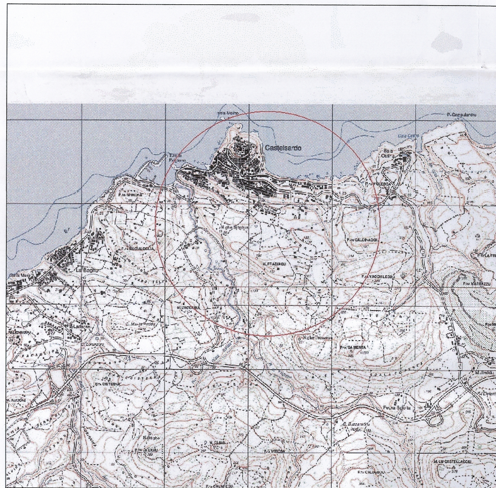
Starlio IGM 25.000 - Foglio 442050 - Castelsardo